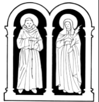
Saint François et Sainte Claire d'Assise